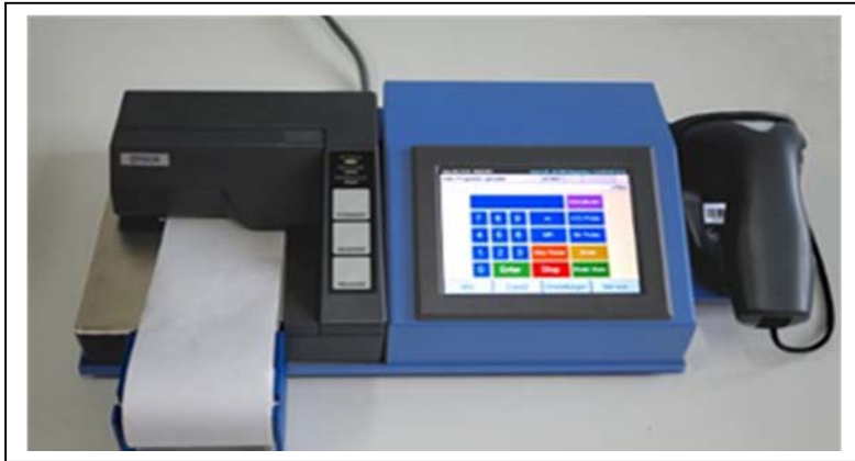
Firma Imetron Sintro 300 in Ringgenberg